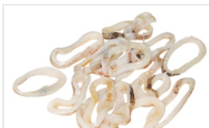
오징어 링커터 제품 Squid ring