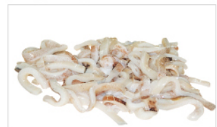
오징어 세절 제품 Sliced product