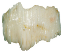
세절 후 오징어 소면