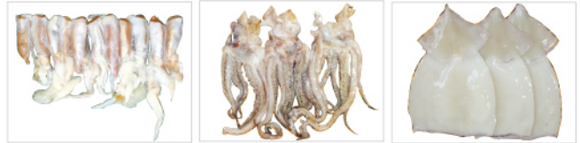
가공 후 오징어 제품 및 내장 Squid products & intestine after processing