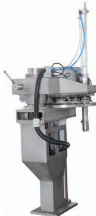
Scraper-type Auto Weight Measuring Machine 스레이퍼형 자동 계량기(면장, 조미료, 작은조각의 야채과일 등)