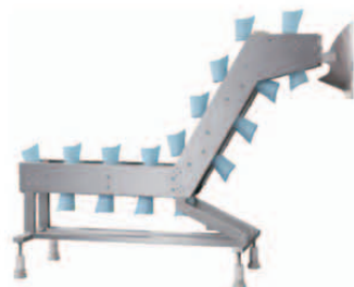
Semi Auto horizontal-type Supplier 반자동 수평식 공급기(오곡, 말린과일)