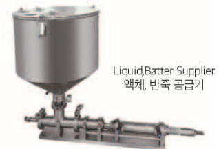
Liquid/Batter Supplier 액체, 반죽 공급기