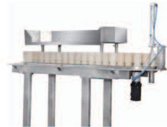
Semi Auto Rotary-type Supplier 반자동 로터리형 공급기(닭발, 닭날개, 오리목, 족발)