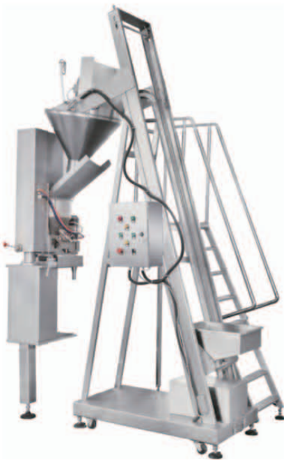
Screw-type Auto Weight Measuring Machine 스크류식 자동 계량기(미역, 김치)